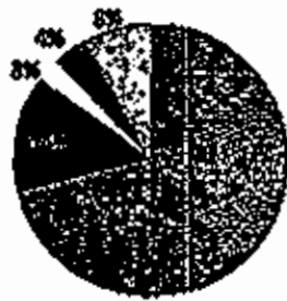
ايرادات القطاعات بالرربع الاول 2010