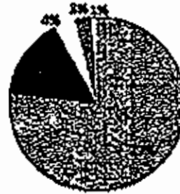
ايرادات القطاعات بالرربع الاول 2011