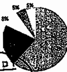
مجمول ربح للقطاعات للربع الاول 2011