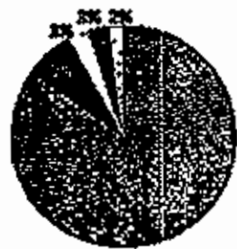
مجمول ربح للقطاعات للربع الاول 2010